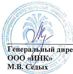
Генеральный директор ООО «ИНК» М.В. Седых

Юридический адрес: 664007, г. Иркутск, просп. Большой Литейный, 4 Адрес для корреспонденции: 664007, г. Иркутск, просп. Большой Литейный, 4 тел. (3952) 211-352, 211-353 ИНН/КПП 3808066311/997250001 ОГРН 1023801010970 р/с 40702810118020101119 Байкальский банк ПАО Сбербанк к/с 30101810900000000607 БИК 042520607 Сайт www.irkutskoil.ru